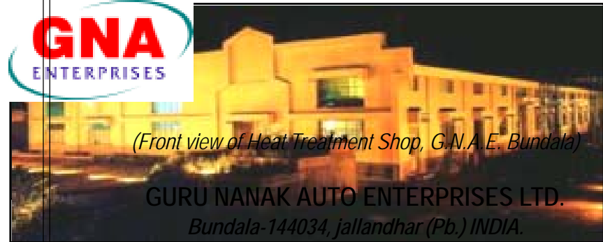
(Front view of Heat Treatment Shop, G.N.A.E. Bundala)